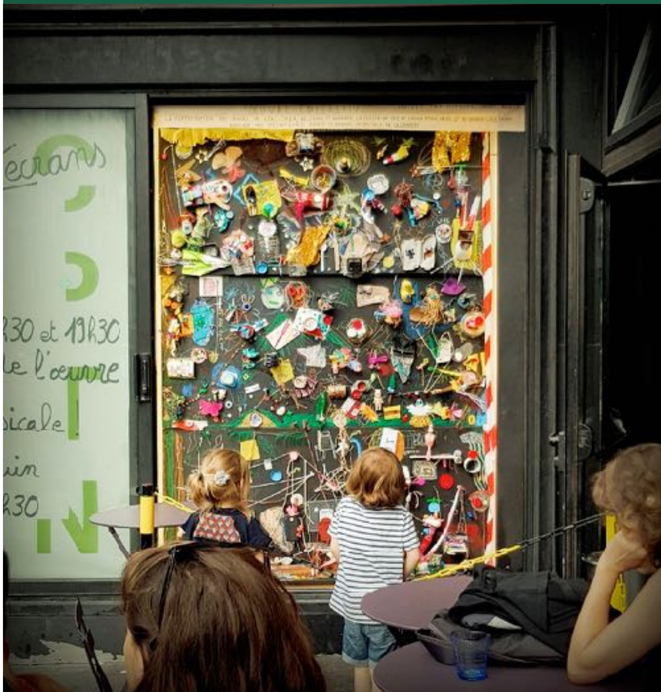
Des morceaux de morceaux, Théâtre de la Bastille / Paris / juin 2018