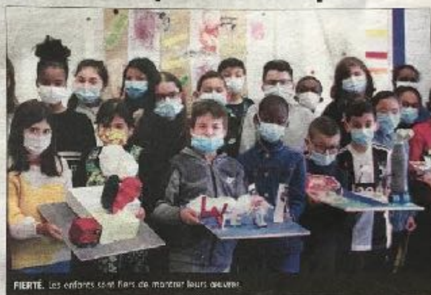
FIERTÉ. Les enfants sont fiers de montrer leurs œuvres.

De ce fait, chaque élève a créé sa propre œuvre en fonction de ses émotions et de ses sensations : « les enfants ont trouvé cette démarche épuisante et surtout frustrante, car certains n'ont pas pu terminer leur réalisation, tant